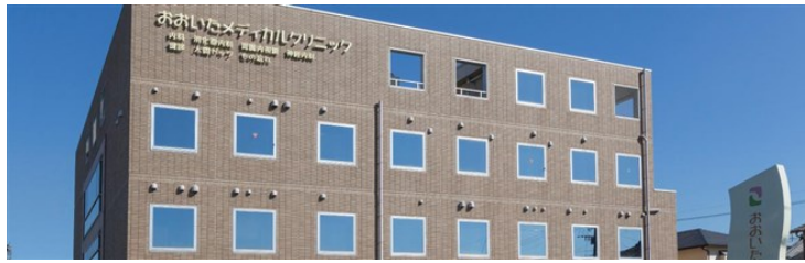
おおいたメディカルクリニックの外観

——新型コロナウイルス感染症（COVID-19）の影響で経営的に厳しくなっているところもあるようですが、いかがですか。